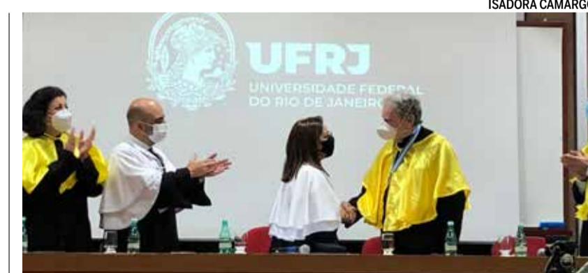
DAVIDOVICH: “É urgente mudar a agenda econômica e social do país”

Presidente da Academia Brasileira de Ciências até o início deste ano, Davidovich não abandonou o tom político em seu discurso de agradecimento. “Estou certo de que o sonho de todos nós é de um país com igualdade de oportunidades para todas as suas crianças, independente do berço em que nasceram. Que incorpore sua população em uma sociedade ilustrada e inclusiva, democrática e produtiva. Esta é a visão que permeia nossas mentes e norteia