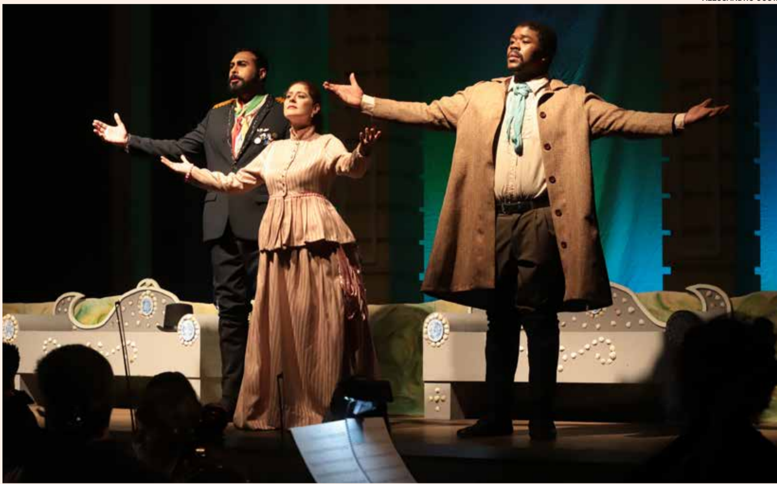
ESPETÁCULO narrou a história do homem negro que lutou pela fim da escravidão no país e é referência na Engenharia brasileira