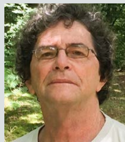
ILDEU Moreira (SBPC)

■ O presidente da Sociedade Brasileira para o Progresso da Ciência, Ildeu Moreira, enviou carta ao ministro da Saúde, Nelson Teich, cobrando medidas mais claras no combate à pandemia do coronavírus no Brasil. E exigindo que as ações sigam as diretrizes da Ciência e sejam defendidas por todos os entes do governo. Caso contrário, os pronunciamentos do Ministério da Saúde poderão se resumir “a informar o número de mortos” nos próximos dias. Outras 40 entidades científicas subscreveram o documento. Leia a íntegra em: https://bit.ly/3f71unW