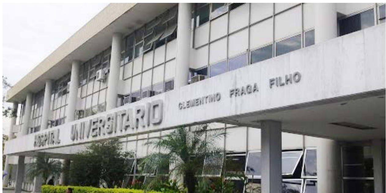
HOSPITAL do Fundão já tem mais 39 leitos de CTI prontos à espera de novos profissionais para serem abertos

Outra opção tem sido a captação de trabalhadores em um edital ampliado da Prefeitura do Rio, com pouco resultado. “Há dificuldades, pois, simultaneamente, a Empresa Brasileira de Serviços Hospitalares, a Fio-cruz e a própria Prefeitura estão contratando profissionais de saúde em grande volume”, explica o coordenador do Complexo Hos-