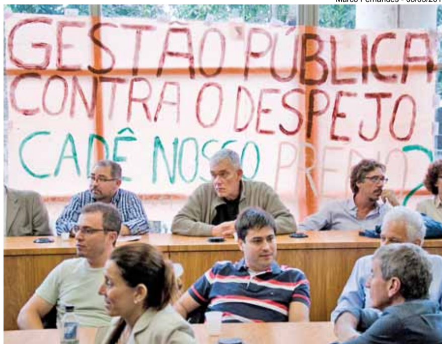
Alunos do GPDES levaram faixa ao Colégio Eleitoral

A Adufrj-SSind vem apontando, há tempos, o problema da terceirização do espaço universitário pelo modelo dos contêineres.