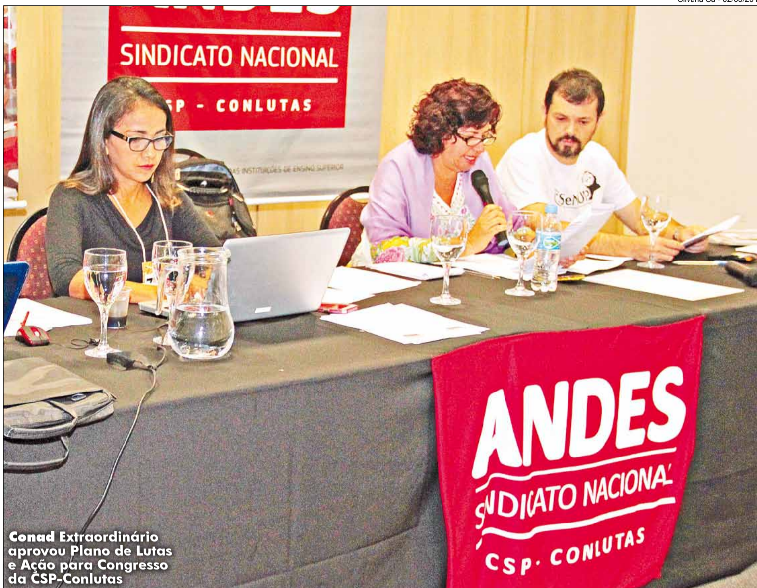
Conad Extraordinário aprovou Plano de Lutas e Ação para Congresso da CSP-Conlutas

Um dos encaminhamentos aprovados no Conad Extraordinário foi o Plano de Lutas e Ação que será apresentado como proposta do Sindicato Nacional à CSP-Conlutas. Ele prevê a intensificação de atividades e políticas unitárias com outras entidades e movimentos sociais classistas para organizar as lutas dentro de uma orientação anticapitalista. Defende, também, a busca pela “mais ampla unidade na luta em defesa do emprego, contra o ajuste fiscal e os ataques aos direitos dos trabalhadores, as terceirizações e toda sorte de precarização do trabalho”. A defesa autonomia sindical (nos termos da Convenção 87 da OIT) foi citada como necessário foco de atuação da central. O texto manifesta o posicionamento contrário à “estrutura sindical verticalizada e de Estado” e ao imposto sindical. Também sugere denunciar a mercantilização da educação, intensificação e precarização do trabalho dos profissionais do setor e que a central mantenha a defesa do princípio da autonomia em relação a governos e partidos políticos.